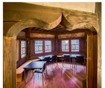
Durch eine gotische Tür in ein besonderes Zimmer.