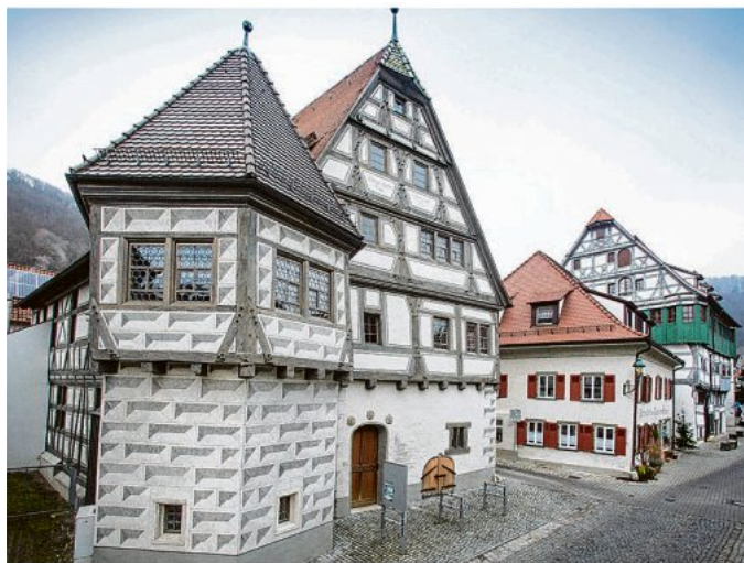
Ein Blaubeurer Bau-Juwel: Vor 25 Jahren startete die Stiftung die Renovierung des „Kleinen großen Hauses“.

Bis 1985 lebten noch drei Eigentümer darin, im ersten Drit-