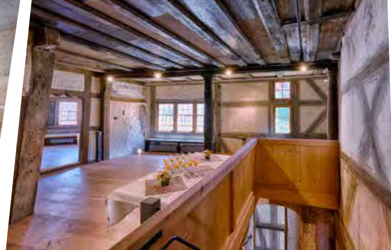
Galerie im Obergeschoss