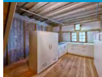
Küche für Catering