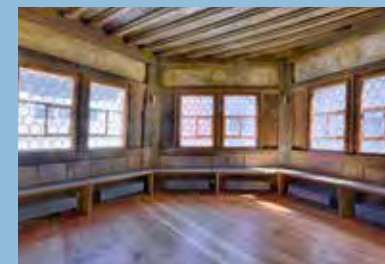
Turmstube im Obergeschoss