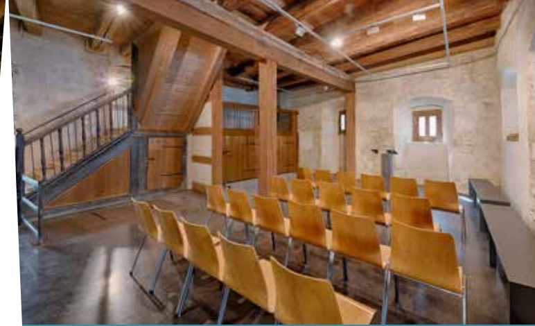
Der große Saal