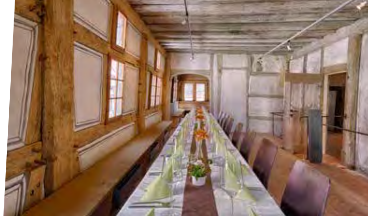
Im Obergeschoss – Große Stube mit Durchgang zur Kleinen Stube